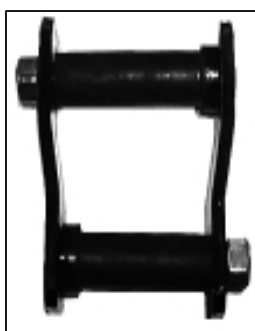
COM PORCAS DE TORQUE 7/16