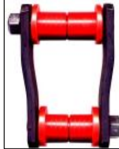
ENB-24370 C/ PINOS 5/8 COD. 702 - PAR

SUBSTITUEM B-24370/2 MUDANDO AS BUCHAS DE BORRACHA PARA BUCHAS ENBMW, COM CHAPAS REFORÇADAS, E MAIOR DISTANCIA ENTRE FUIROS