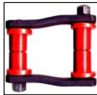
ENB70/2MW - COD. 960 SUBSTITUI B-24370/2 MUDANDO AS BORRACHAS PARA BUCHAS ENBMW (COM PINOS 1/2") PAR