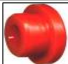
BUCHA PARA O JUMELO OLHETE TRASEIRO DA MOLA H100 ENB-822MW = COD. 985