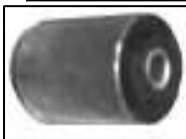
BUCHA SILENCIOSA P/MOLA TRAS. PARTE DIANT. E TRAS. AA70A-28033 =COD. 446