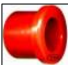
BUCHA P/ MOLA TRAS. PARTE DIANT. E TRAS.(METADE) ENB-28033MW = COD. 970