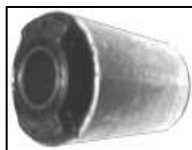
BUCHA SILENCIOSA PARA MOLA TRASEIRA PARTE DIANTEIRA 5547-43002 = COD. 447