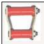
ENB-939MW JOGO L200 PARA MOLA TRASEIRA - PAR COD. 087