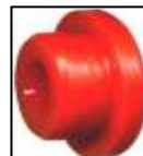
BUCHA P/ SUPORTE PARTE MOVEL ENB-815MW = COD. 951