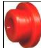
BUCHA DA MOLA TRAS. PARTE DIANT. NISSAN FRONTIER CODIGO 907 - (ENB-872 MW) = R$ 63,00