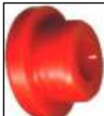
BUCHA DA MOLA TRAS. PARTE TRAS. NISSAN FRONTIER 2 PARTES CODIGO 036 - (ENB-435 MW) = R$ 135,00 ( O PAR)